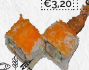
Kushi maki garnaal