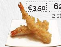
Ebi tempura gefrituurde garnaal