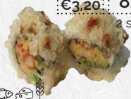
Taruki maki rivierkreeft